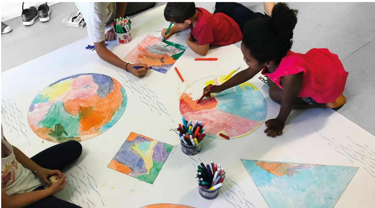
Mondiale! Pontifichiamo!: il tappeto/mappa con i paesi da ridisegnare

progettuale corretta in termini interculturali nel primo caso e verificarne l'efficacia in termini educativi nel secondo caso.