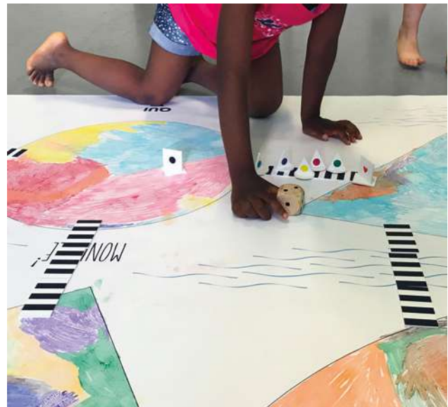
Mondiale! Pontifichiamo!: il tappeto/mappa con i ponti che collegano i paesi, credits Valentina Frosini

comunità future maggiormente inclusive. In un contesto così delicato e complesso, il/la designer può rappresentare un «acceleratore di cambiamenti», nella consapevolezza però che questo impegno gli/le chiederà di «superare i confini disciplinari settoriali e agire nel progetto in modo interdisciplinare» (Germak 2008, p. 67): per questo motivo tutto il percorso è stato condiviso con due co-tutor, rispettivamente esperti in antropologia e pedagogia, al fine di costruire una proposta