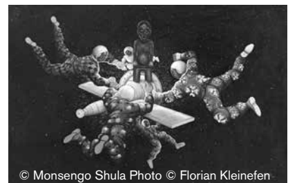
© Monsengo Shula